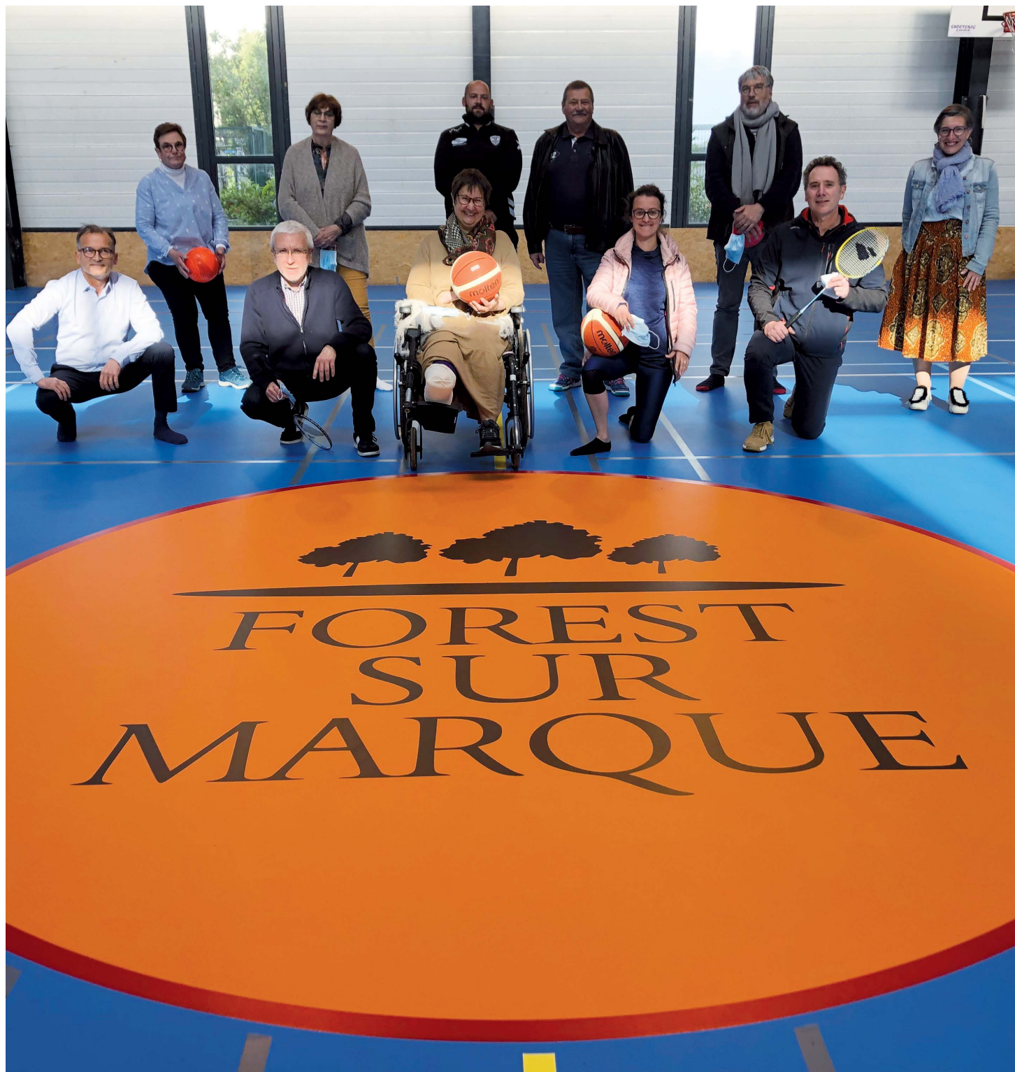
L'équipe municipale réceptionne le nouveau sol de la salle de sport.