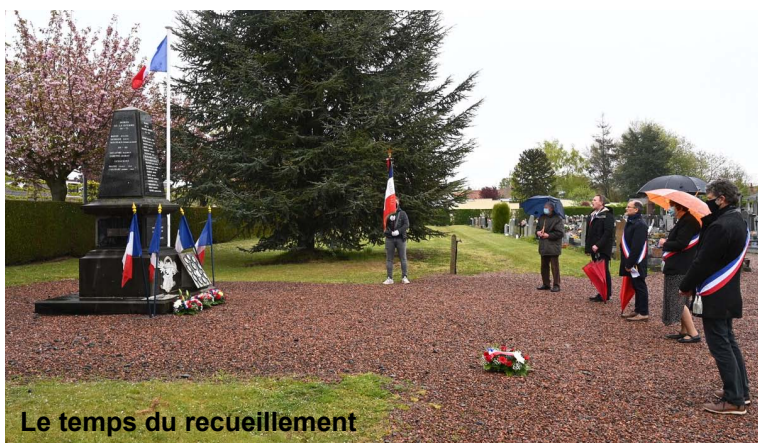
Le temps du recueillement