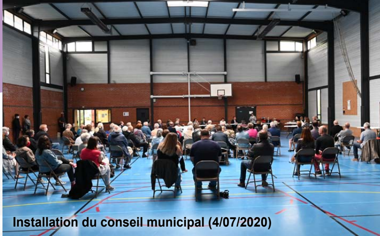
Installation du conseil municipal (4/07/2020)